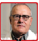
פרופ' יעקב שכטר