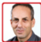
פרופ' גיל בר סלע