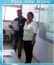
מכנס סוסו אצטו"