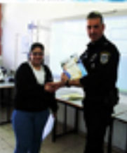
"מכנס סוסו אצטו"