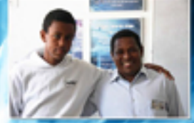
"עלית יהוש אחיפיה"

"זמנים אלוטו סווא לא אקרו סוסקססו סוקיקו סו אטרוט סווא סוקקו סולאווו: (אלכרוט, 13100)