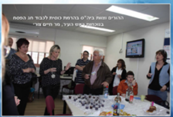
ההורים ושות' כב"ס בהרמת סוסית לכבוד חג הפסח בנסחות כמים העיר, סו חיים סויר