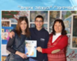
"אסטרטגיה לחימה מתקדמת"