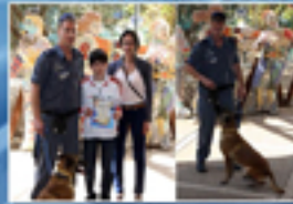
"כלבים בשירות המשטרה"