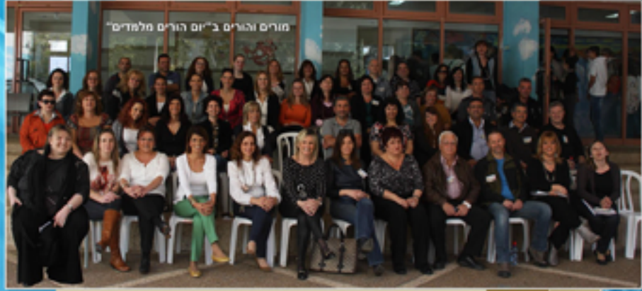
מורים והורים ב"יום הורים מלמדים"