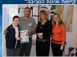
"קיימות ואיכות הסביבה"