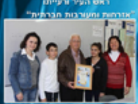
ראש העיר רועייית אזרחות ומעורבות חברתית"