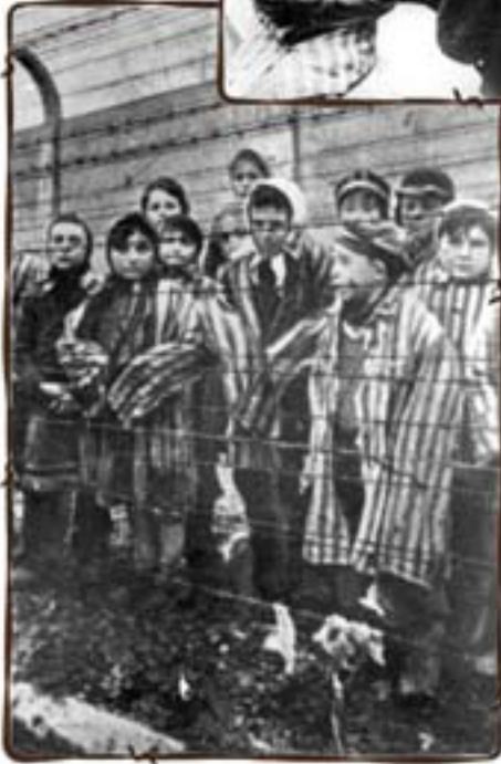
ילדים לידי הגדר