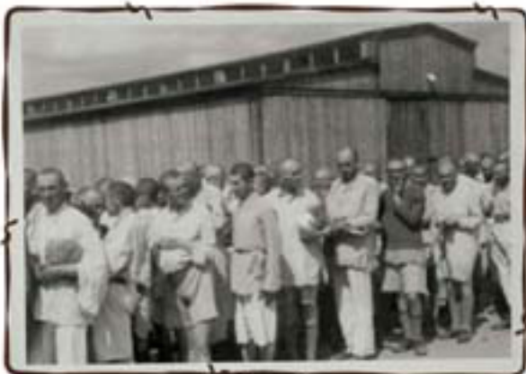
גברים כשירים לעבודה לאחר טיהור מנינים