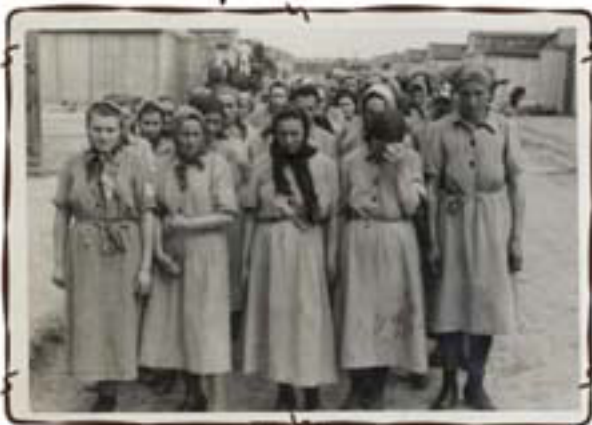
נשים כשרות לעבודה לאחר טיהור מכינים