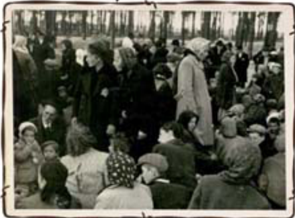
מסתינים בחורשה שליד תא הנזים להריגתם