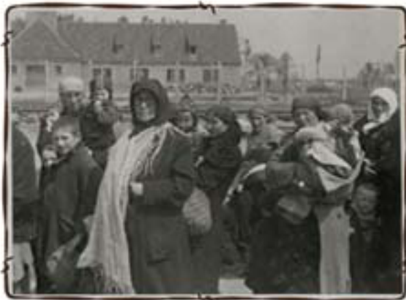
סובלים לתאי הגזים – ברקע המשרות