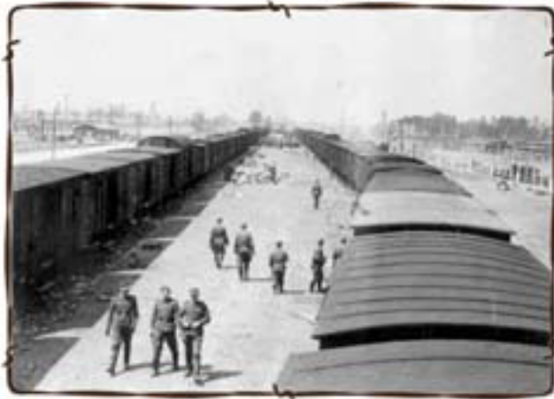
הנעת טרנספורט לרציף אשוויץ-בירקנאו

בבירקנאו פעלו תאי הגוים והמשפחות של מרכז ההשמדה של אשוויץ. אי 3-בנות-מונביץ העד 45 מחנות משנה, היו בעיקר מחנות עבודה. האסירים, רובם יהודים, עבדו במרד עד אילפת כוחות בשביל חברות גרמניות.