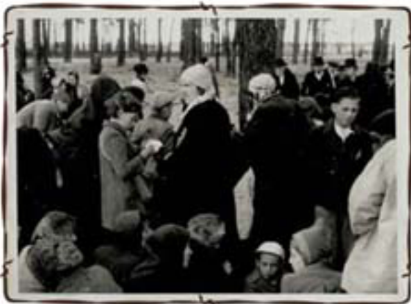
מסתינים בחורשה שליד תא הנזים להריגתם