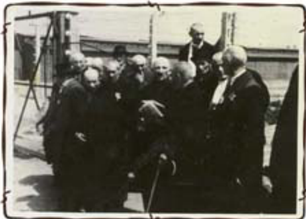
קשישים מסתינים לפני הובלתם לתאי הגזים