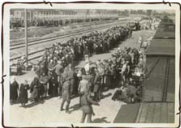
סלקציה על הרציף- בקרע האנשים בדרכם לתאי הגזים