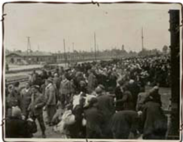
רק הניעו – לפני הסלקציה