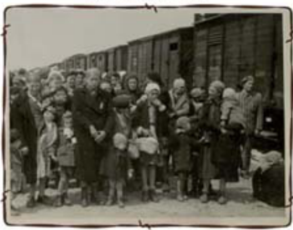
על הרציף - לאחר הירידה סהרמבת