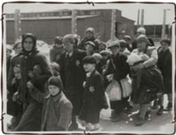
סובלים לתאי הגזים