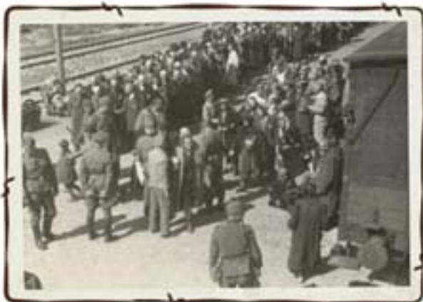
סלקציה על הרציף בירי אנשי ס"ס