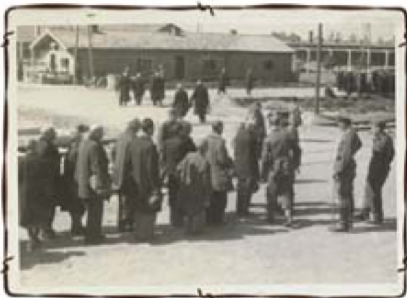
סלקציה על הרציף בירי אנשי ס"ס