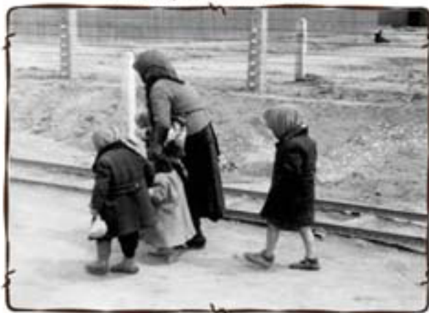
בלתי כשירים לעבודה – לתאי הגזים