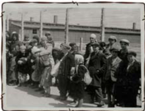
נשים וילדים סובלים אל תאי הגזים