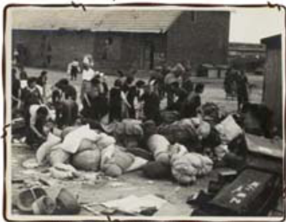
מיון החפצים במרכז הביזה שזכה לשם 'קנדה'