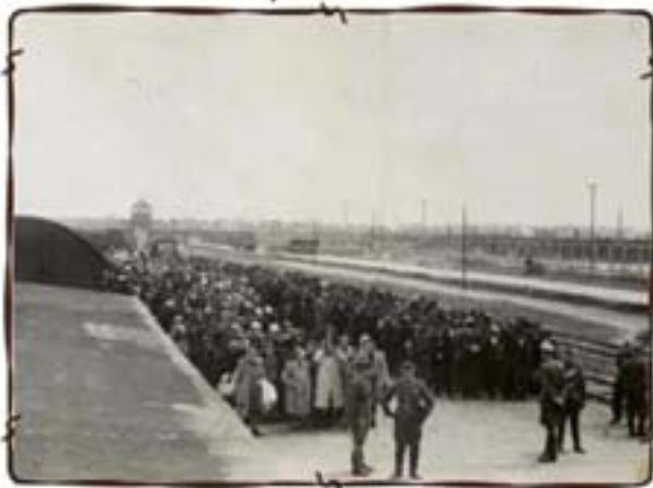
סלקציה על הרציף בידי אנשי ס"ס