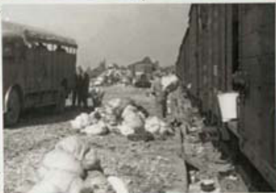
חסעי האנשים שנשארו על הרציף