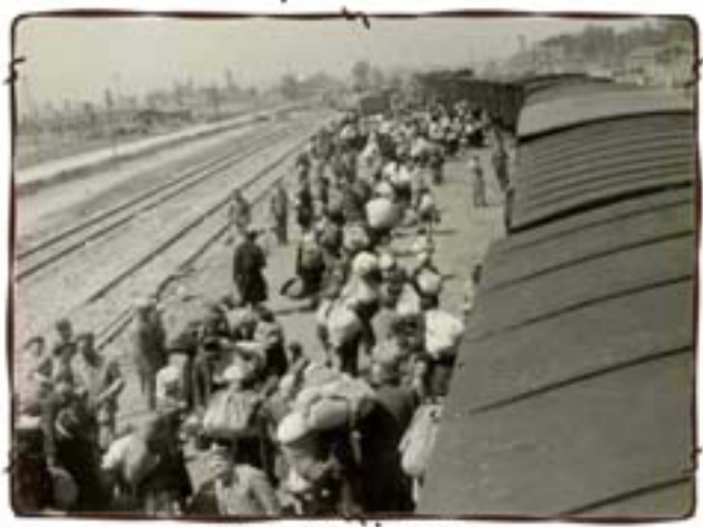
סהרמבת לאושוויץ - בירקנא