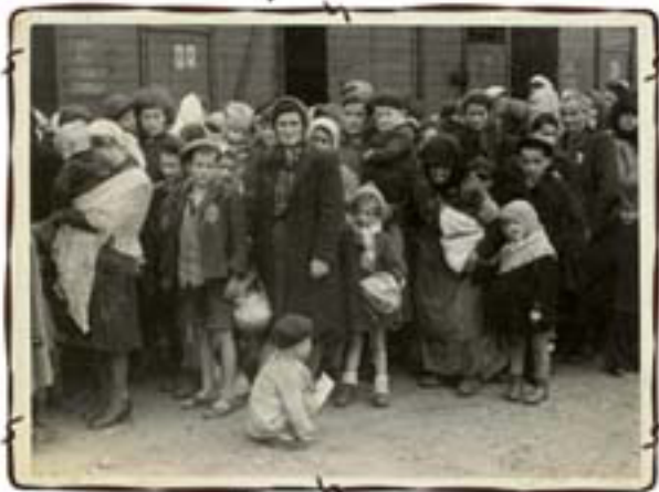
רציף הרכבת – נשים וילדים