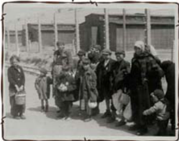
נשים וילדים סובלים אל תאי הגזים