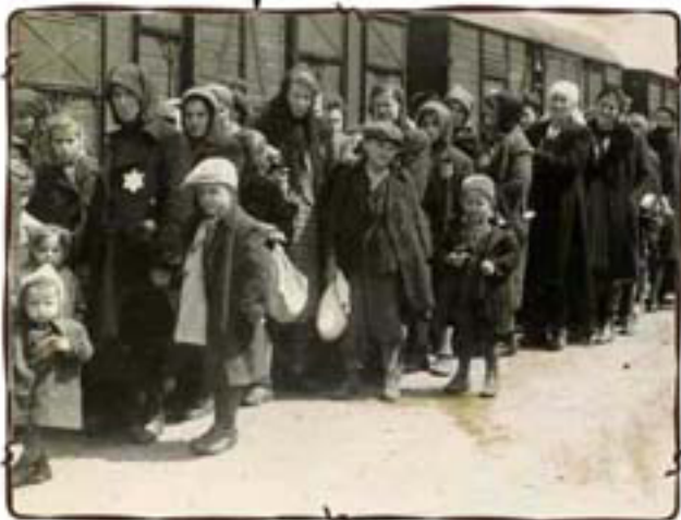
מהרכבת לאישוויץ - בירקנאו