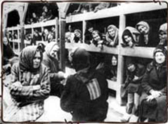
סראה מניסי של צריף נסים באושוויץ