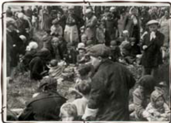
סמתינים בחורשה שליד תא הנזים להריגתם