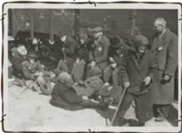
יוערו להשמדה בסלקציה-סמתינים על הרצוף להשמדה