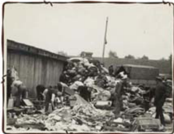
מיון החפצים האישיים של אלה שהגיעו זה עתה