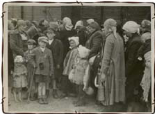
על הרציף לאחר הירידה מהרכבת