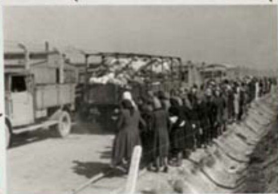
החסעים שהועמסו על המשאיות