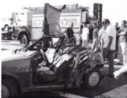
זירת תאונת דרכים

מכה לרשות הרישוי: בית המשפט העליון דחה הבוקר (ב') את הערעור שהגישה פרקליטות המדינה וקבע כי רשות הרישוי אינה רשאית לפסול לתקופות ארוכות את רשימותיהם של נהגים עבריינים סדרתיים בהסתמך על סעיף 56 לפקודת התעבורה.