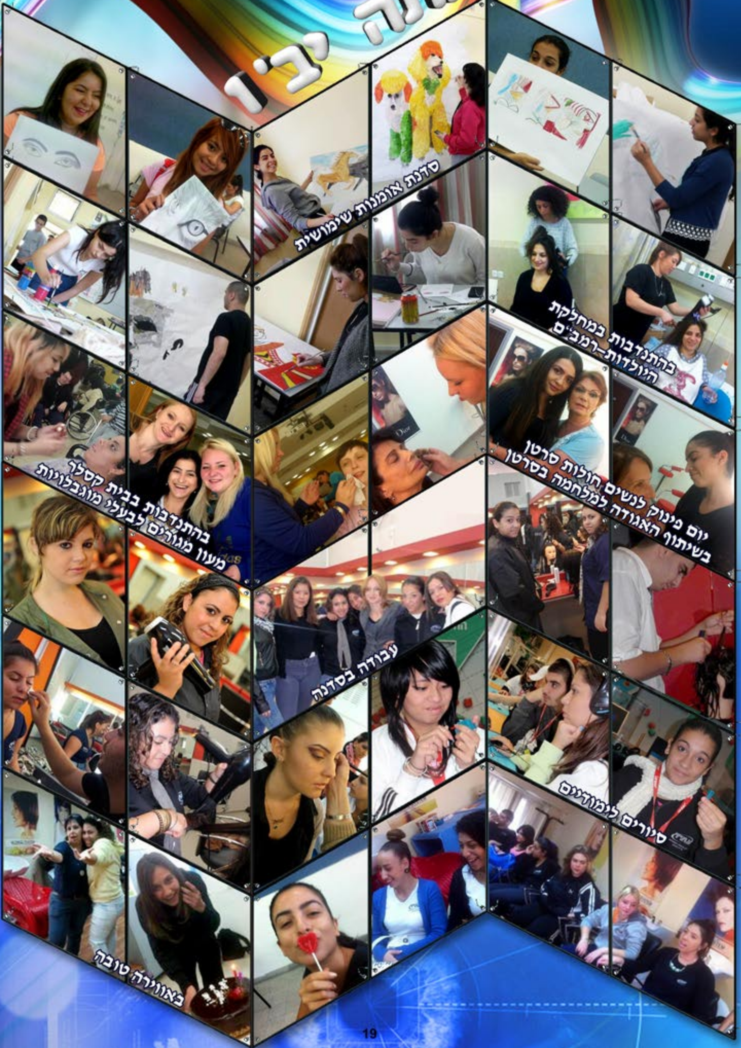
סדנת אומנות שימושית